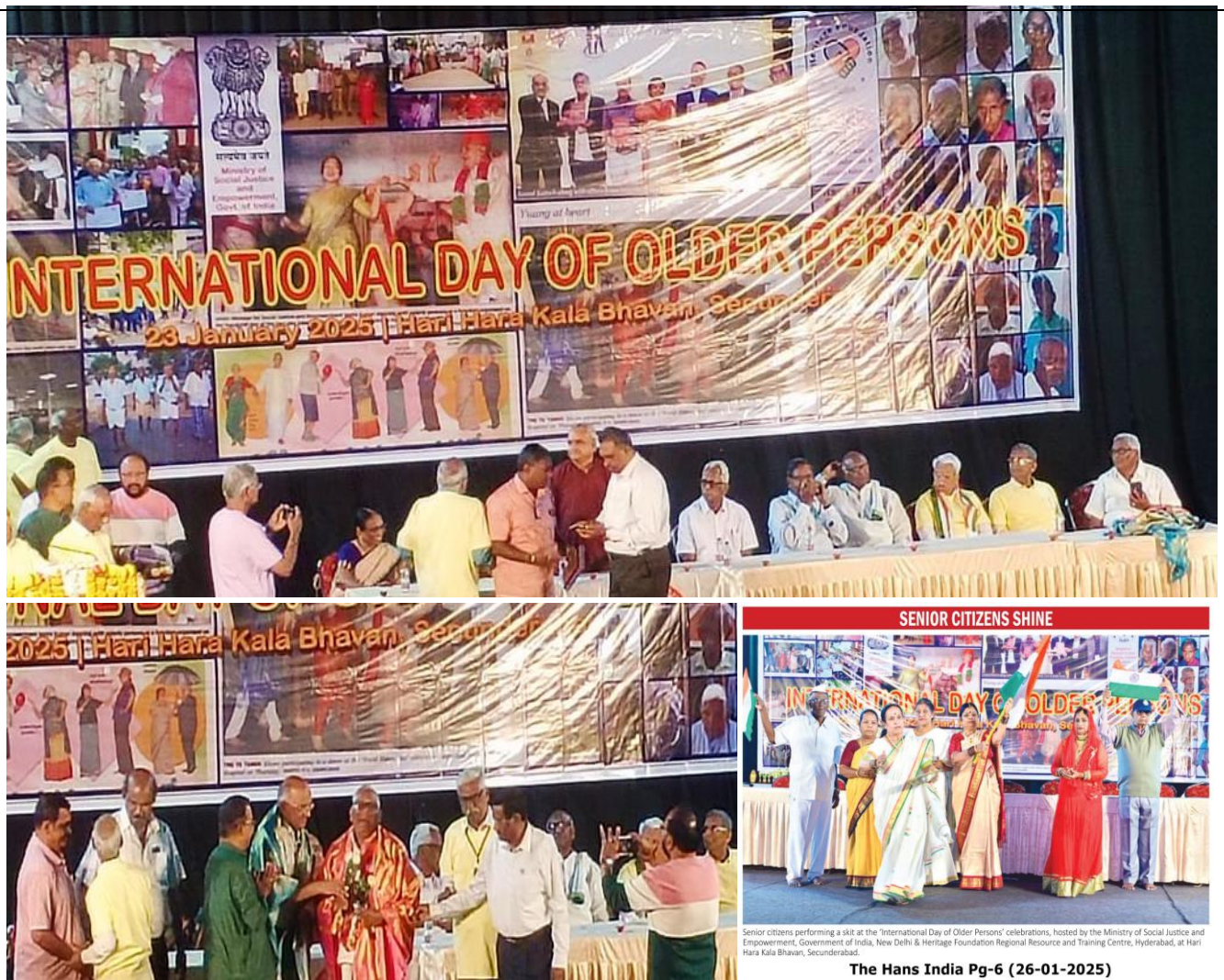
The Hans India Pg-6 (26-01-2025)

Union Government-sponsored programme to celebrate the International Day of Older Persons (IDOP-2024) at Hari Hara Kala Bhavan, Secunderabad on 23 rd Jan.25. The seniors received T-Shirt, etc.