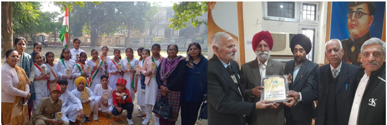
Senior Citizens Welfare Council Khanna celebrated Republic Day.

ਸੁਰੱਖਾ ਕਰ ਸਕਦੇ ਹਨ। ਉਨ੍ਹਾਂ ਨੇ ਅਪਣੇ ਧੋਨ ਕਰੇ ਹੋਏ ਹੋਏ ਸੇ ਬਚਾਏ ਦੇ ਵਿਭਿੰਨ ਤਰੀਕੇ ਦੱਸੇ। ਉਨ੍ਹਾਂ ਨੇ ਦੱਸਿਆ ਕਿ ਧੀਆਧੀਵੀ ਦੀ ਰਿਵਾਜ ਮੇਂ ਰਿਪੋਰਟ ਕੈਸੇ ਕਰੇ। ਅਕਸ਼ਯ ਫਿਰੋਡਿਓਰ ਜੇਏਸ ਜਗਦੇਵ ਨੇ ਸਾਰੀ ਪ੍ਰਤਿਭਾਸ਼ਿਲੀ ਦਾ ਸ਼ਾਗਤ ਕੀਤਾ ਅਤੇ ਦੱਸਿਆ ਕਿ ਹਮਾਸ ਪ੍ਰਧਾਨ ਹੈ ਕਿ ਹਮ ਅਪਣੇ ਸਦਸਯੋ ਕੋ ਆਨੇ ਵਾਲੇ ਸੰਘਵਿਤ ਖੇਤਰੀ ਦੇ ਬਾਰੇ ਮੇਂ ਅਕਤੀ ਰਚਣ ਸੇ ਅਵਗਤ ਰਹੇ। ਸੇਮਿਨਾਰ ਮੇਂ ਲਗਭਗ 200 ਸਦਸਯੋ ਨੇ