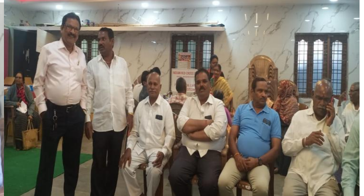
A Medical Camp with 80 general and 55 for eye checkups.