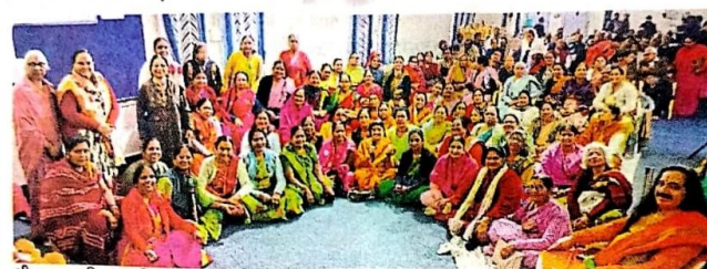
भीलवाड़ा. वरिष्ठ नागरिक मंच भवन में भजन-कीर्तन करती महिलाएं।