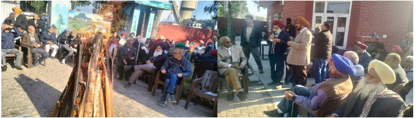
Senior Citizens Council Rajpura celebrated Lohri in Council Bhawan.