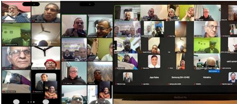
ShehjaarZoom meeting was held on 20/1/25 connecting members from all ShehjaarCenters Pune, Haridwar, Bhubaneshwar, and Faridabad.