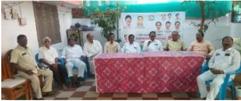
Awareness on Revers Mortgage in their office in Metapally.