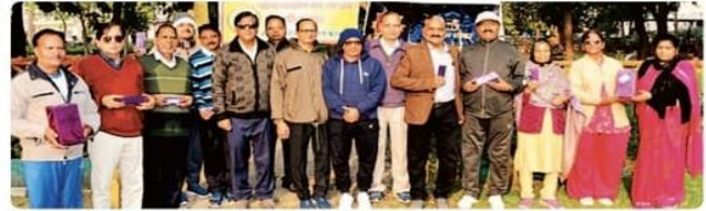
भीलवाड़ा. विजेताओं को पुरस्कृत करते हुए अतिथि।