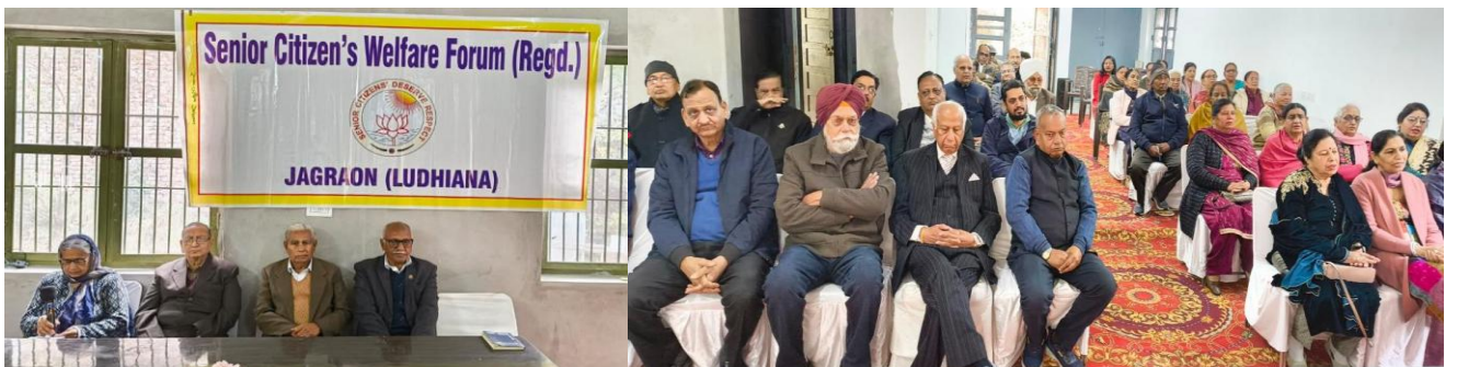
New Year celebrations by Senior Citizens Welfare Forum Jagraon on 31st. Dec.24.