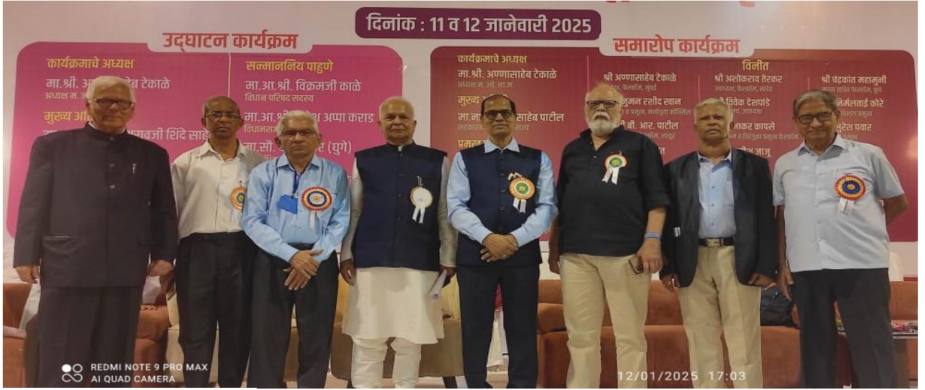
मुलाकात of 12-1-2025 लातूर