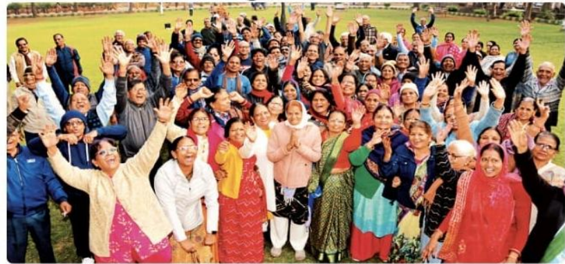
भीलवाड़ा. शिवाजी गार्डन में कार्यक्रम के दौरान ठहाके लगाते हुए वरिष्ठजन।

मंच अध्यक्ष खटोड़ ने राजस्थान पत्रिका का धन्यवाद दिया। कहा-रोजाना सुबह घाय की दुस्की के साथ पत्रिका पढ़ना अनिवार्य सर्रोखा है। बिना पत्रिका के कुछ अधूरा लगता है। पत्रिका के साइबर क्राइम अभियान को सराहा।