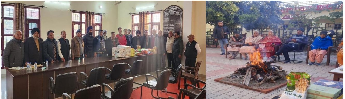
Senior Citizens Association Bassi Pathana celebrating Lohri at Old Age Home Bassi Pathana with Rotary Club Sirhind Bassi Pathana.