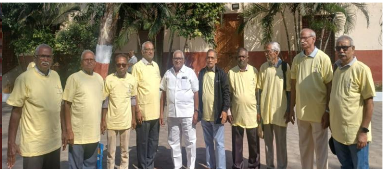
IDOP Celebrations at Harihara Kala Bhawan in Hyderabad.