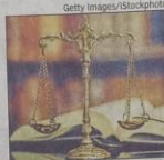
Senior citizens face difficulty in articulating their case before the tribunals

Sources said a proposal is on the table to allow lawyers to take up cases of senior citizens before tribunals under the "Maintenance and Welfare of Parents and Senior Citizens Act", while keeping the bar intact on use of legal professionals by children against whom the cases are filed.