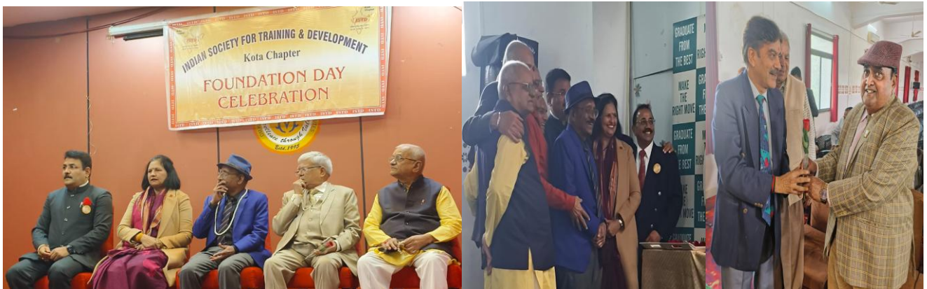
Indian Society for Training & Development Kota Chapter Foundation Day celebration at Om Kothari Group of Educational Institutes.