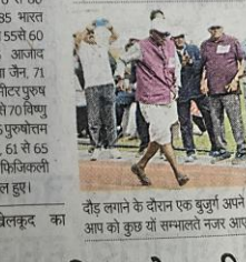
दौड़ लगाने के दौरान एक बुजुर्ग अपने आप को कुछ यों सम्भालते नजर आए।