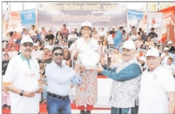
पटेल स्टेडियम में प्रथम वरिष्ठजन स्पोर्ट्स