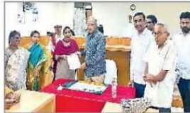
కీచిరాడికి అవార్డు కాపీ అందించిన సందర్భం

విజయవాడ నేరవార్తలు, న్యూస్ టుడే : విజయవాడ మండల న్యాయసేవాధికార కమిటీ ఆధ్వర్యంలో శనివారం నిర్వహించిన జాతీయ లోక్ అదాలత్ లో 5,093 కేసులు పరిష్కరించి, రూ.20.59 కోట్ల పరిహారం ఇవ్వబడింది. మొత్తం 12 బెంచ్ లు ఏర్పాటు చేశారు. సివిల్, మోటారు యాక్సిడెంట్ కేసులు, స్త్రీల టిగేషన్ కేసులు, రాజీవ్ దగ్గర్ క్రిమినల్ కేసు