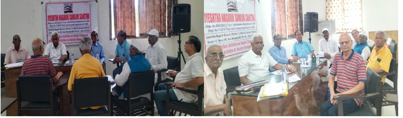
JNSS Meeting on 29-3-25.