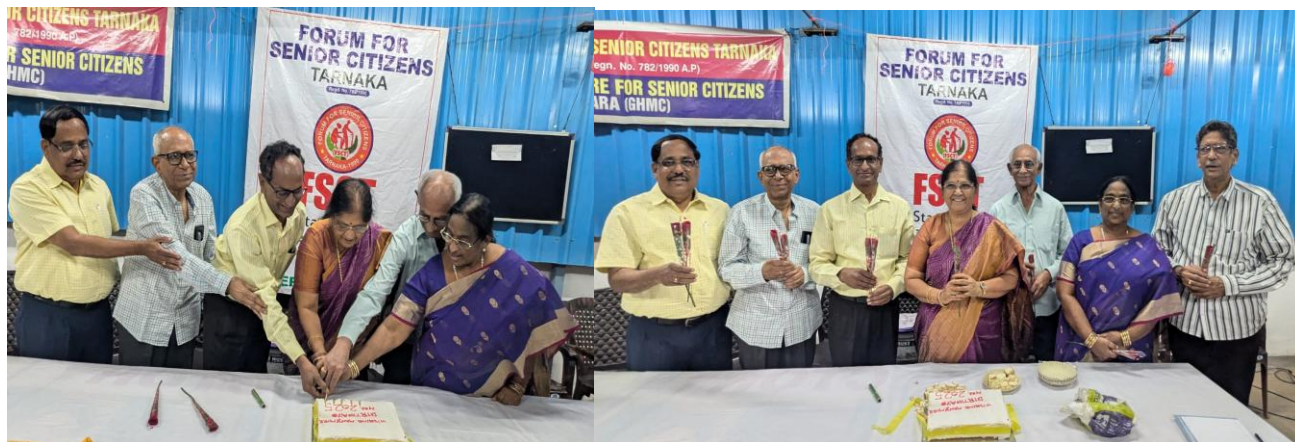
March 2025 monthly birth day celebrations in Forum for Senior Citizens Tarnaka, attended by 70 members.