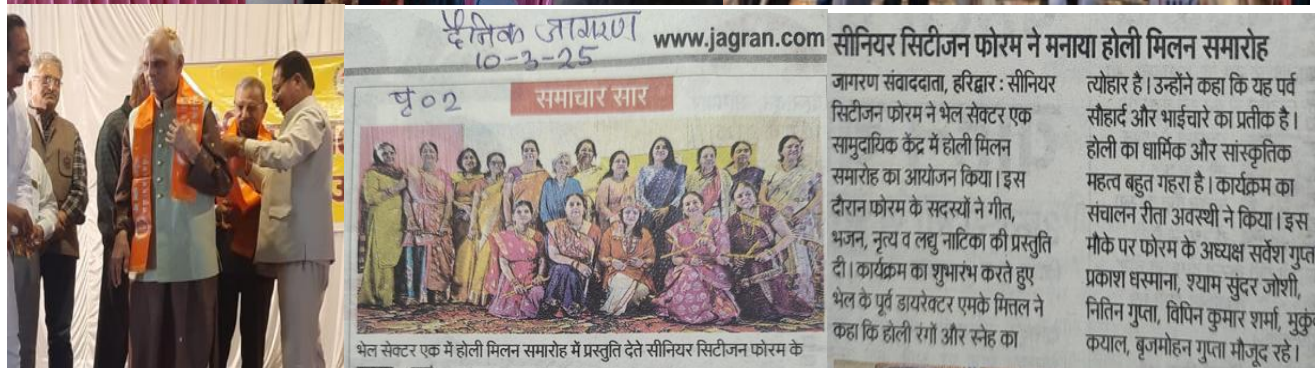
SCF Haridwar: celebrated the annual Holi festival.

A Workshop on 18 th March at Hotel Prasant Haridwar, organized by Anugrah RRTC New Delhi and SCF Haridwar under the banner of