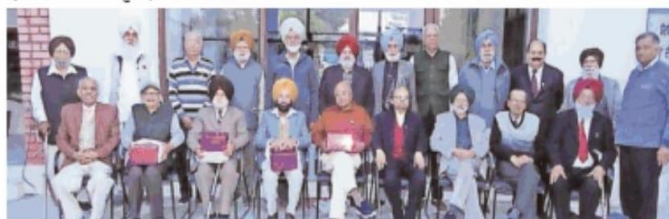
वरिष्ठ नागरिक कल्याण संघ के पदाधिकारी व सम्मानित सदस्य।