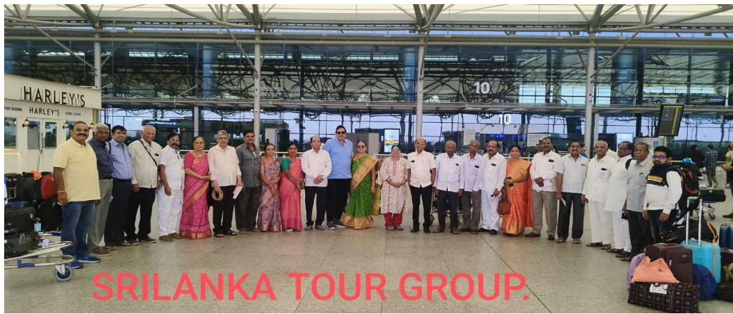
Telangana State Govt. Retired Employees Association's 24 members for Sri Lanka tour on 6 th March from Badichowdi.