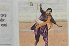
खेलकूद प्रतियोगिता में तस्ती फेंकती बुजुर्ग महिला।