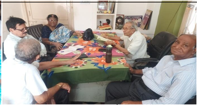
Trust's visit to Lahari OldAge Home and Trinity OldAge Home on 22 nd April.