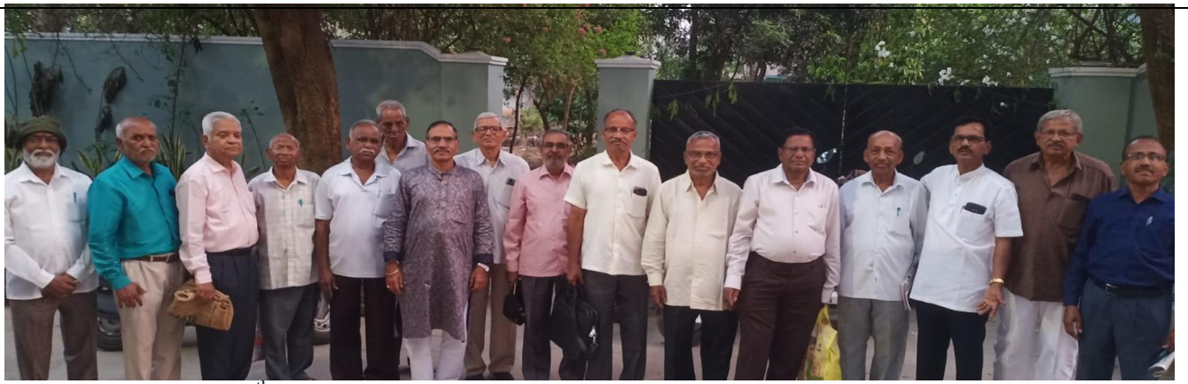
ASCA Meeting on 10 th April, 2024