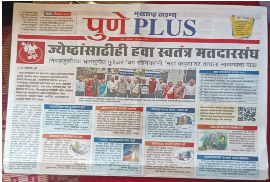
From Maharashtra Times of 22 nd April.