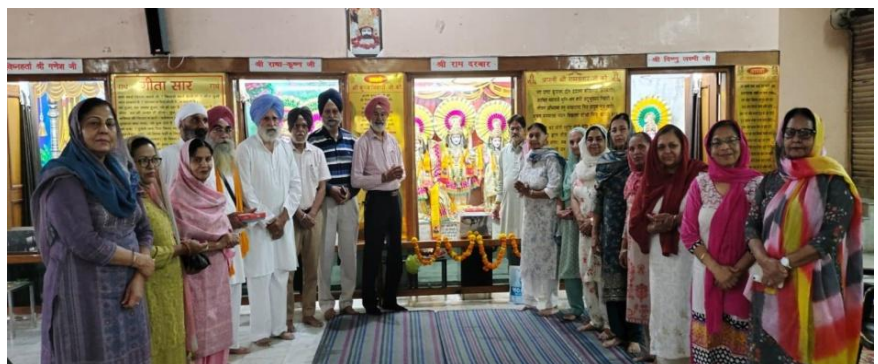
SCC Bathinda: Ram Nomi at Vaishno Mata Mandir Bathinda on 17 th April.