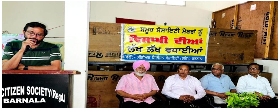
Senior Citizen Society, Barnala.