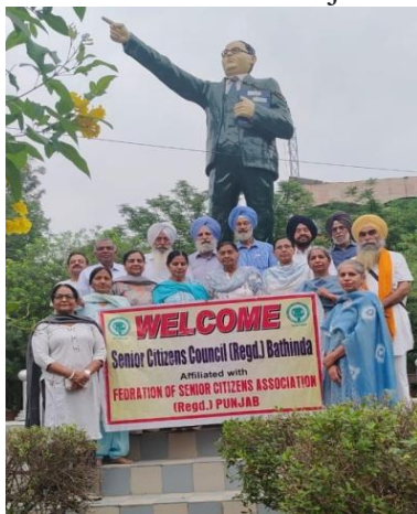
SCC Bathinda: Celebrates Dr. B.R. Ambedkar on 14 th April.