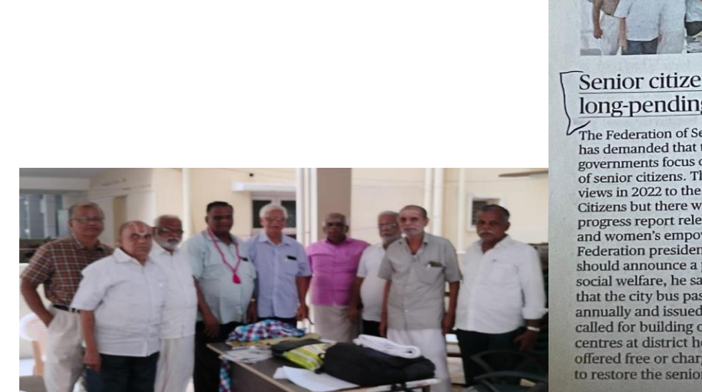
Senior citizens want their long-pending demands met has demanded that the State and Central governments focus on the long-pending demands of senior citizens. The federation submitted their views in 2022 to the State Council for Senior Citizens but there was no information about the progress report released by the social welfare and women's empowerment department, said Schould announce a policy on elders as leaders in that the city bus passes be made renewable annually and issued without any restrictions. It called for building old age homes and day care confered free or charged, and wanted the Centre to restore the seniors' rail fare concession.