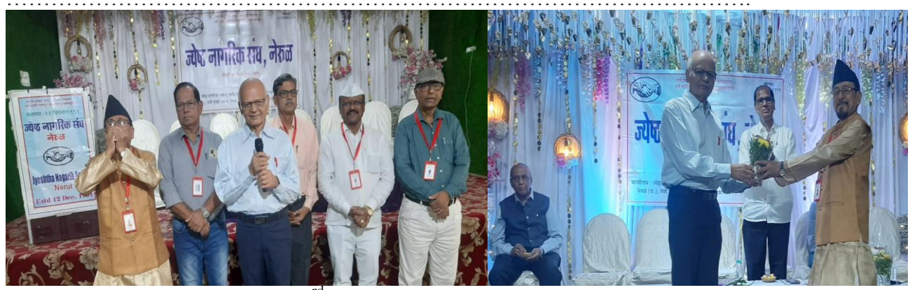
A program at Bhavan Nerul on 23^{rd} May.