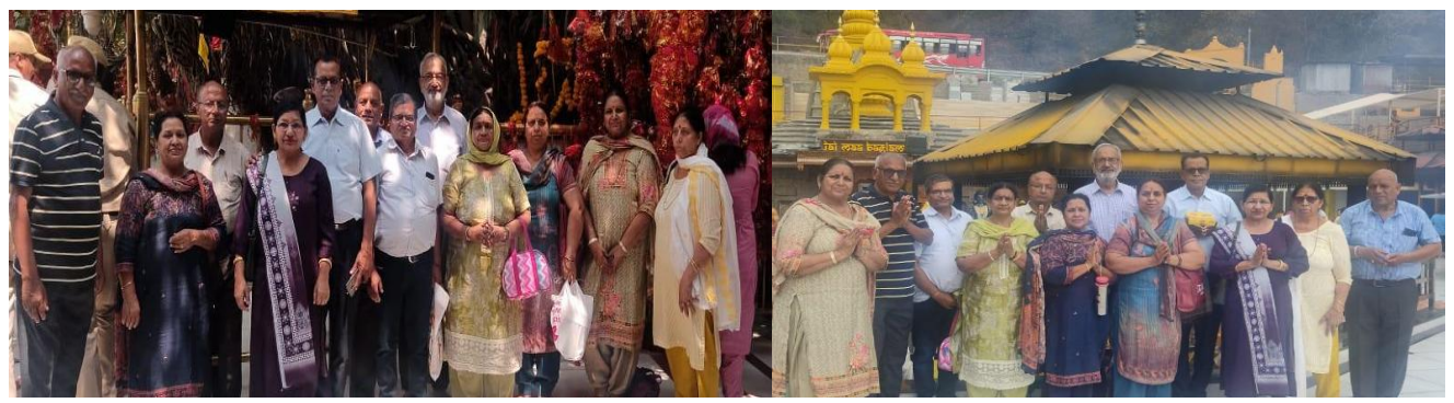
Senior Citizens Welfare Forum, Jagraon undertook a religious family trip.

सीनियर सिटीजन कौंसिल मोगा ने एक विसीय टूर लगाया