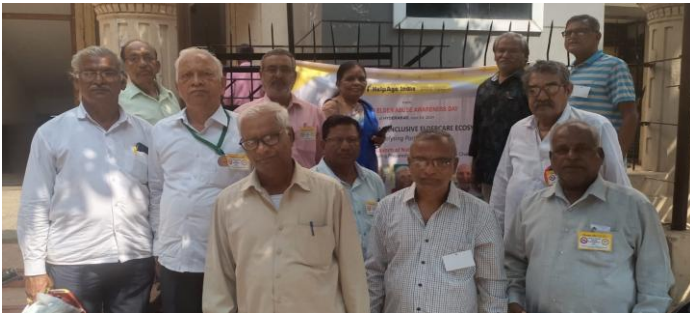
Alwal SCA members attended WEAD P.P. presentation at Sundarayya Vignana Kendram, Chikkadpally.