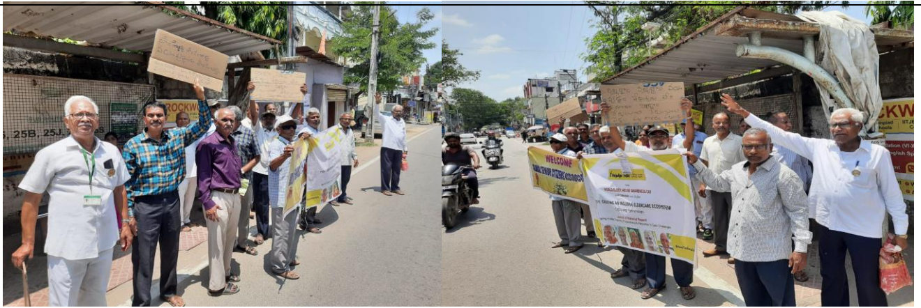
ASCA members's procession from Navakala kendram, GHMC circle, Alwal Police station, Rajiv Gandhi Circle, Telangana Thalli statue Circle and through main road and back to Navakala kendram with slogans.