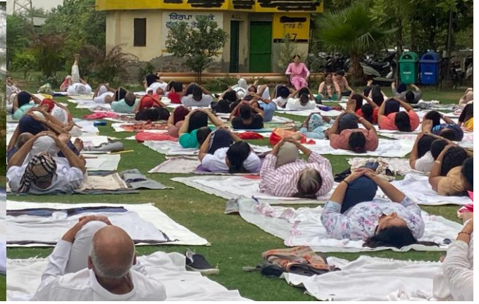
International Yoga Day celebrated at Senior Citizens Council of Ludhiana Model Town.