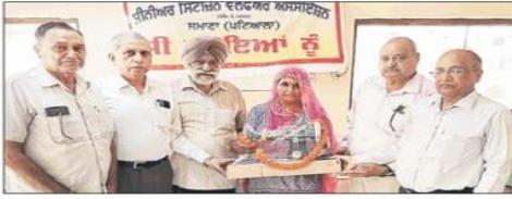
जरूरतमंद परिवार को सिलाई मशीन देते हुए सीनियर सिटीजन वेलफेयर एसोसिएशन समाना सदस्य।