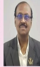
करताना जेष्ठानांच्या मागण्या लक्षात घेऊन आर्थिक तरतूद करावी अशी

आज जाहीर झालेल्या यांनी स्वतंत्र मंत्रालय स्थापन अर्थसंकल्पात पुनः एकदा जेष्ठ नागरिकांच्या प्रलंबित मागण्यांना वाटाप्याच्या अंदात लावण्या आहेत. भारतामध्ये २०५० साली जेष्ठानी आताच्या तुलनेत पुढील मुळावे जवळ जवळ २५ ते ३० कोटी होईल याचा विचार केंद्र व राज्य सरकार यांनी करावयास पाहिजे. रेलवे यात्रेसाठी वरिष्ठ नागरिकांच्या यात्रेसाठी १८% GST हटवणे, आरोग्य सेवा आणि प्रवासाच्या सवयी यावर दुर्लक्ष करून घालणार नाही. या सारंगी केंद्र व राज्य सरकार