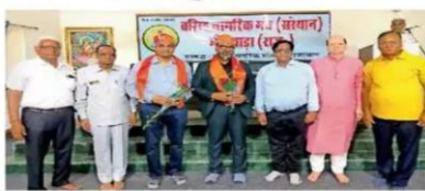
वरिष्ठ नागरिक मंच का हेल्थ कनेक्ट प्रोग्राम में मौजूद वरिष्ठ नागरिक।